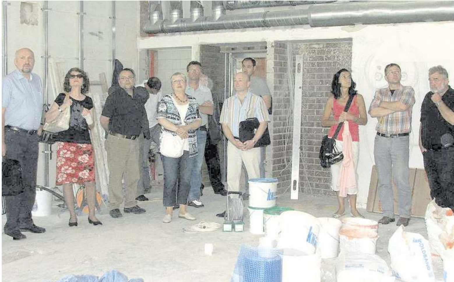
Skeptische Gesichter, viele Zweifel und eine Frage: Wird die D.-Paul-Eber-Schule rechtzeitig bis zum neuen Schuljahr fertig? Bei der Baustellenbesichtigung vor der Sitzung des Stadtrats am Donnerstag waren die Zweifler in der Mehrheit.

Für landwirtschaftliche Flächen soll indes ein Privileg greifen. Solange die landwirtschaftliche Nutzung dauert, würden die Beiträge gestundet. Aber aufgeschoben ist natürlich nicht aufgehoben.