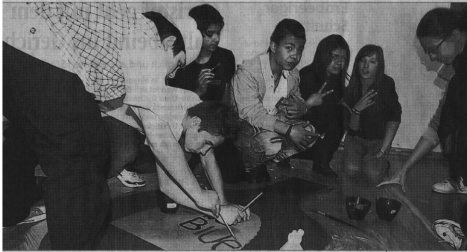
Da soll noch mal einer sagen, die jungen Leute heutzutage seien nicht kreativ. Diese Siebtklässler beweisen das Gegenteil. „Sweet Blue“ taufen sie ihr alkoholfreies Partygetränk, das sie mit einem überdimensionalen Plakat in Flaschenform bewerben.