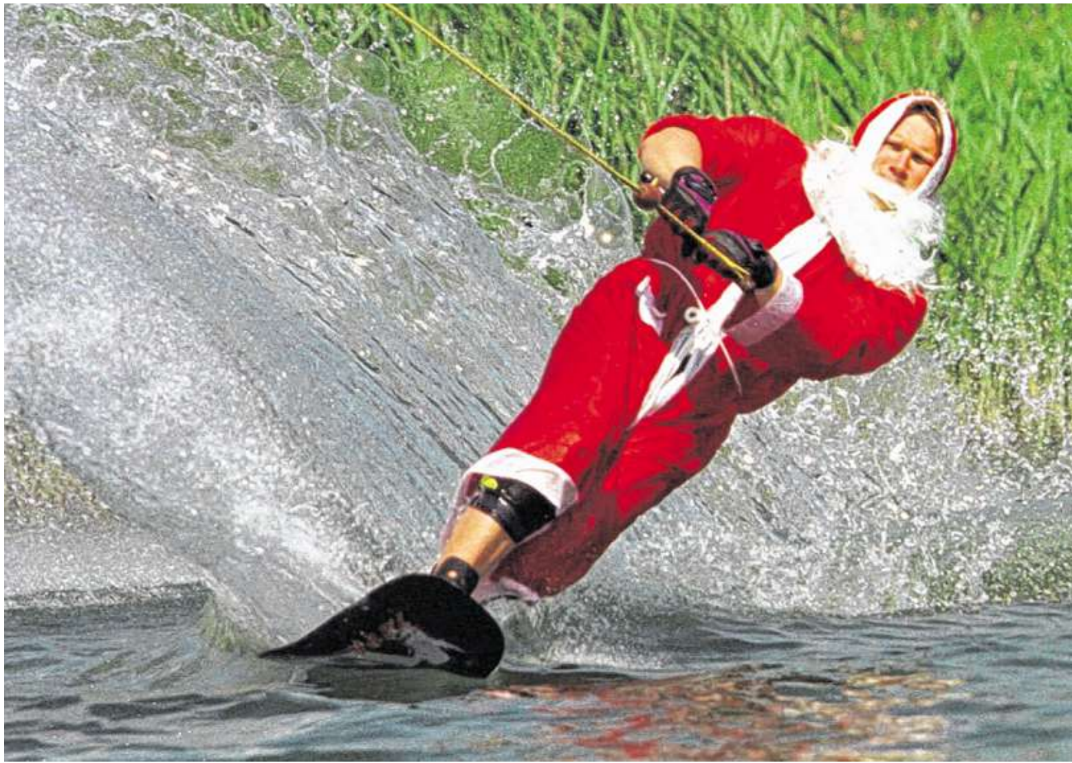
Was macht der Weihnachtsmann im Sommer? Schüler des Franken-Landschulheims Schloss Gaibach erforschten so manches, was im Jahresablauf verrückt ist.

An einem Samstag befassten sich 23 Zehnt- und Elftklässler des Armin-Knab-Gymnasiums in Kitzingen bei einem Projekttag mit dem Thema „Potenziale entdecken und entwickeln“. In Zusammenarbeit mit dem Verein „Talente entwickeln“ sollen im Rahmen der vertieften Berufsorientierung die Stärken und besonderen Kompetenzen der Schüler entdeckt und bestärkt werden. Es ging um Berufsvorstellungen und Ziele und um Anforderungen der Unternehmen an zukünftige Mitarbeiter.