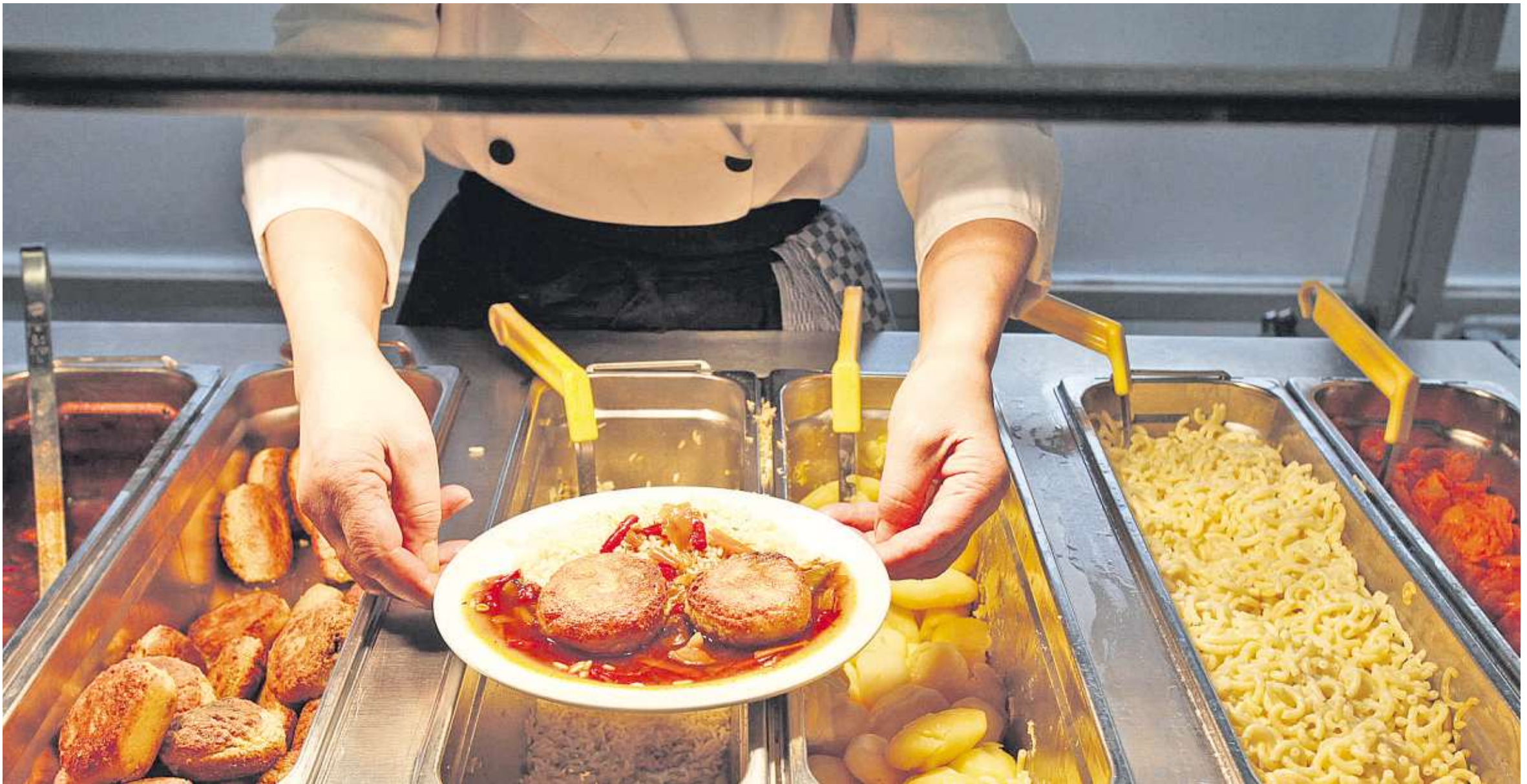
Statt zum Schulbus in die Mensa zum Essenfassen: Veränderte gesellschaftliche Verhältnisse und ein Umdenken in der Bildungspolitik stellen die Schulen vor neue Herausforderungen, denen sie mit intelligenten Betreuungs- und Verpflegungsangeboten begegnen müssen.